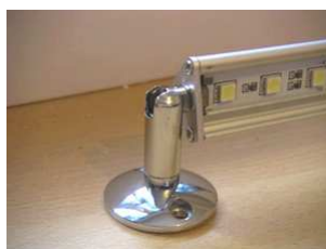
Fixation applique pour cornière à Led Borée