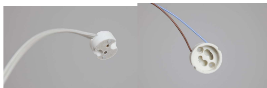
Douilles Gu5,3/G4 et GU10